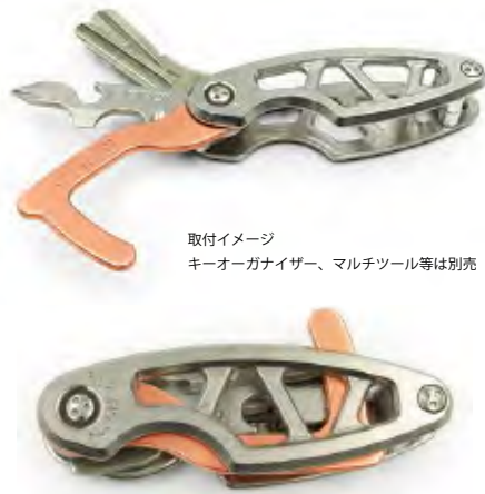
取付イメージ キーオーガナイザー、マルチツール等は別売