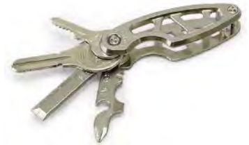
同 FACTRON ブランドで発売中の「キーオーガナイザーリーフ」とのセット販売も

加工の難易度が非常に高いチタニウム削り出しのカラビナ。チタニウムは強固で軽量。サビに強くアレルギーも少ない素材で、医療用にも使われます。シンプルながらも存在感のあるデザインで、数字の8がモチーフの同素材のジョイントパーツと2重リング2個が付属します。緻密な削り出し加工で製造し、研磨や組み込みは手仕上げです。切削痕（ツールマーク）のデザインまで緻密に考え抜いて設計されています。腕時計のデザインがスタートで、緻密なプロダクトを得意とする弊社ならではの製品です。