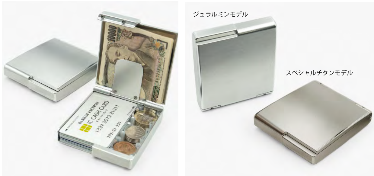
ジュラルミンモデル

メタル削り出しデザインプロダクト「FACTRON（ファクトロン）」の有限会社ファクタデザイン（本社：東京都大田区）は、キャッシュレス時代にスマートにお会計シーンを格上げする、航空機素材のジュラルミンやチタン削り出しの金属のお財布『メタルウォレット Boxy（ボクシー）』を2022年11月30日（水）より「Makuake」にて先行販売を開始予定です。