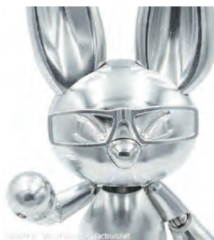
付属メガネパーツ