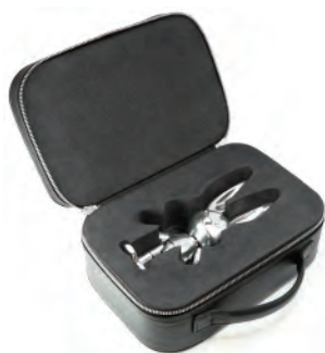
専用本格レザーケース付

付属品は、ウサギのしっぽ風のラビットテールのほか、キツネのしっぽ風のフォックステール、磁石で簡単に着け外しができるメガネパーツ。磁石で着脱可能な取り換えフェイスパーツのオプションも今後ラインナップしていきます。持ち運びができる本革のレザーケース付きです。受注生産で、注文後約 90 営業日で発送します（土日祭日休業）。