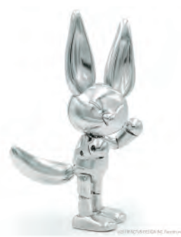
付属フォックステール